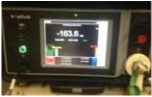
图2, 带有PIM分析仪的高性能测试装置为不同电路层压板提供PIM值测试

从2002年开始, 罗杰斯公司就对PIM进行实验室定期测试, 并形成了层压板行业内无与伦比的技术和数据知识库。安装于罗杰斯R&D实验室内的Summitek 1900b是罗杰斯公司的第一个PIM测试设备, 该设备用于研发和材料的定期验证。2015年初, 罗杰斯公司在天线级材料生产基地增加了两台Kaelus iQA-1921c设备 (图2)。常规定期监测PIM值已经成为罗杰斯公司标准产品过程的一部分。